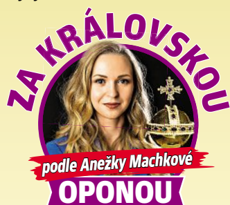
podle Anežky Machkové