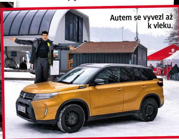
Autem se vyvezl až k vleku.