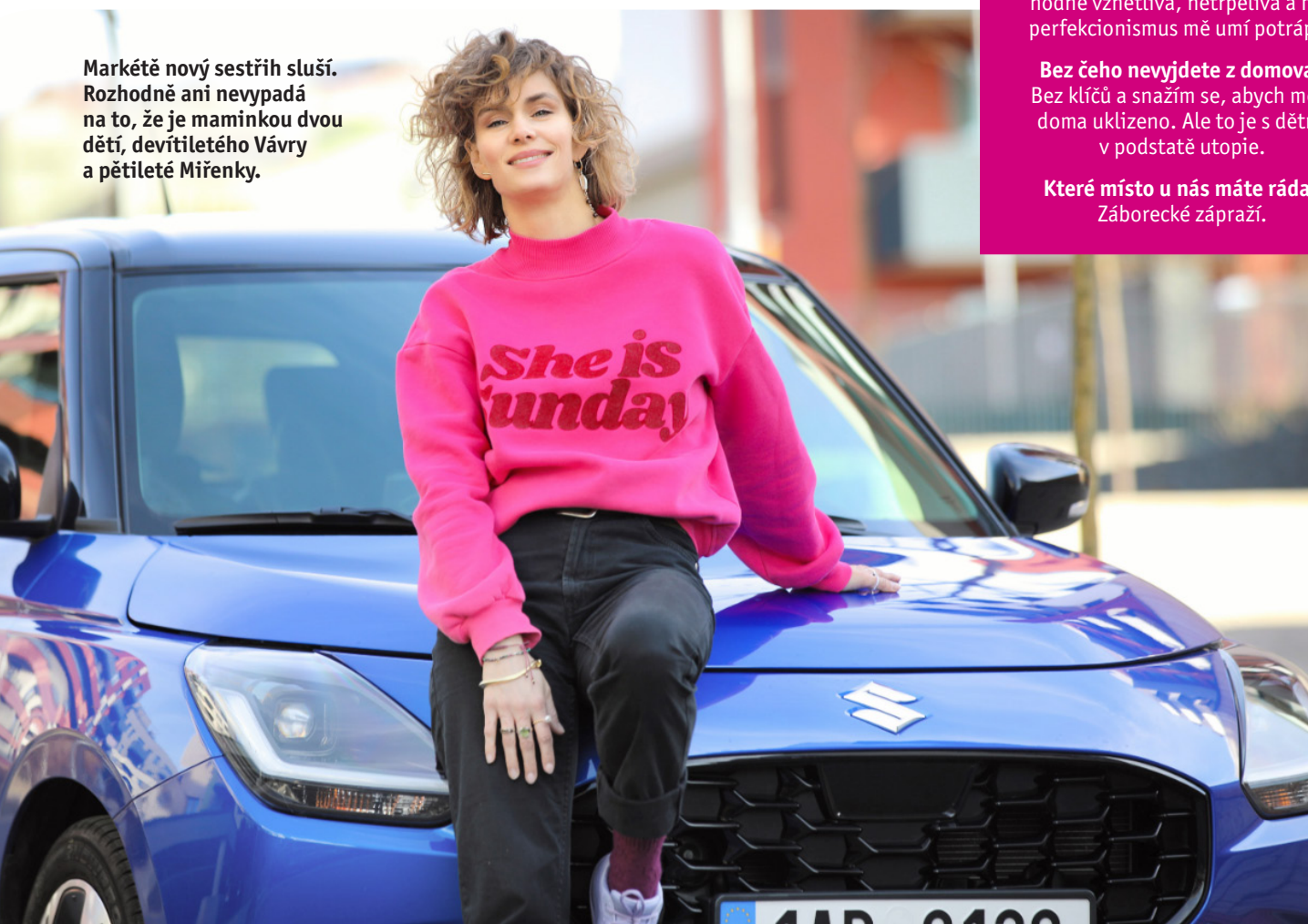
Přípravila: Šárka Jansová, foto: archiv Markéty Dergelové a xxxxxxxx