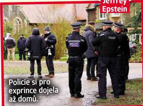
Policie si pro exprince dojela až domů.