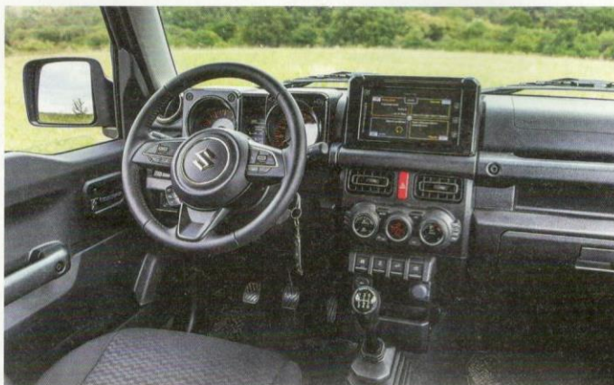
OVLÁDÁNÍ OKEN je kvůli úspoře místa ve výplních dveří na středovém panelu.

Vnitřek je stejně jako vnějšek účelnost sama. Tvrdé plasty zde jsou kvůli odolnosti, ovládání všeho máte při ruce, vertikálně stavěná palubní deska neukrajuje vnitřní prostor. Oproti minulé generaci mají sedačky větší rozsah posuvu a vyšší opěradla, takže se zde pohodlně usadí i hřmotnější jedinci. Zadní sedadla jsou ale vysloveně nouzová, jet na nich delší vzdálenost než pár kilometrů vážně nechcete. //