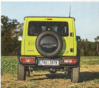
ZADNÍ SVĚTLA v nárazníku šetří místo v okolí pátych dveří, vstupní otvor tak může být větší.