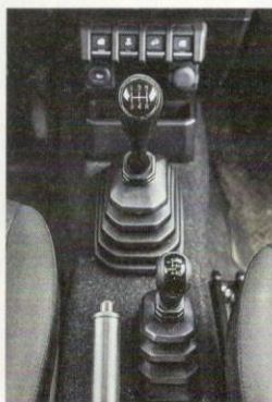
PÁKA Pohonu všech kol se pohybuje pouze vpřed a vzad.