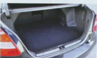
>> Zavazadelník má průměrný objem 461 l