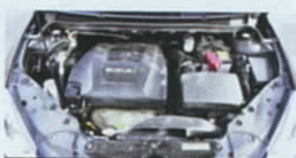
>> 2,4 litru bez přeplňování a 131 kW