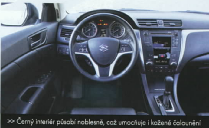
>> Černý interiér působí noblesně, což umocňuje i kožené čalounění