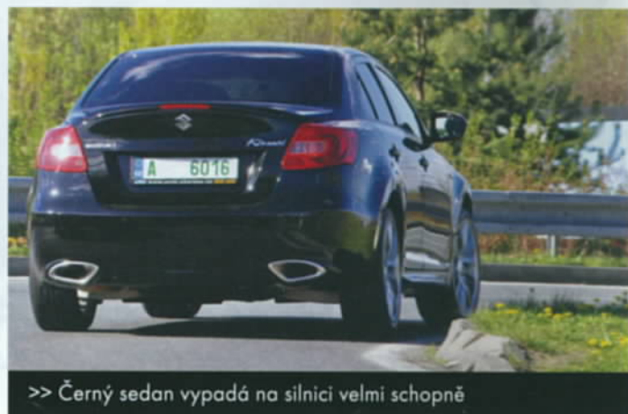
>> Černý sedan vypadá na silnici velmi schopně

ním průměrem, odmění se vám Kizashi na čtyřválec velmi kultivovaným projevem. Například při rychlosti 130 km/h si vystačí s otáčkami 2300 1/min. Sportovní jízda má v Kizashi specifický projev typický pro bezstupňové převodovky. Pod plným plynem se otáčky vyhoupnou k maximu, ale rychlost stoupá pomaleji, než bys-