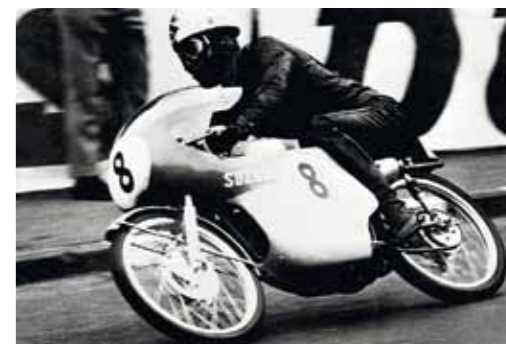
Dva roky po první účasti Suzuki v závodě Isle of Man TT přišlo první vítězství ve třídě do 50 cm³