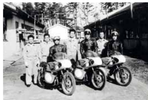
Rok 1960 a první účast Suzuki ve slavném motocyklovém závodě Isle of Man TT