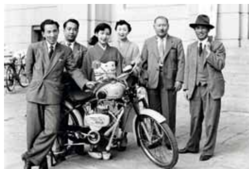
První motocykl Suzuki, pojmenovaný Diamond Free, se představil v roce 1953