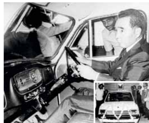
Indický vůz Maruti 800, vzniklý v úzké kooperaci se Suzuki, se začal vyrábět v roce 1983