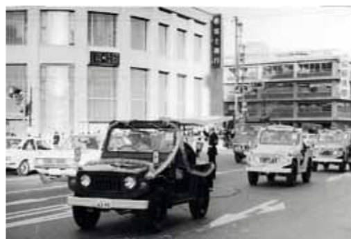
Model Jimny první generace vyjel v roce 1970. Vyrábí se dodnes, a sice už ve čtvrtém vydání.