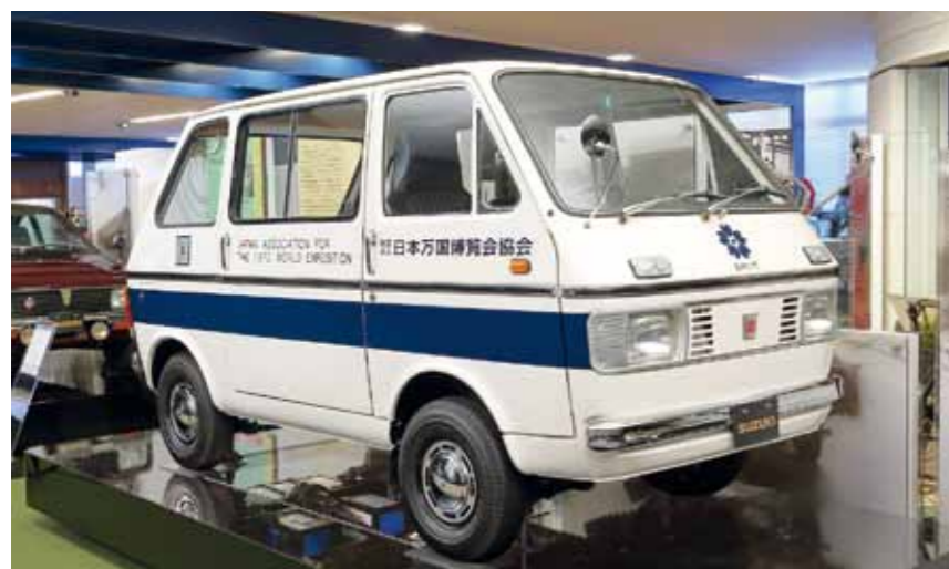
První elektromobil Suzuki vznikl v roce 1970 původně pro výstavu Expo 70 v Ósace. Technicky vycházel z modelu Carry Van (L40V) a zajímavé je, že pod design karoserie se podepsal Giorgetto Giugiaro ze slavné firmy Ital Design.