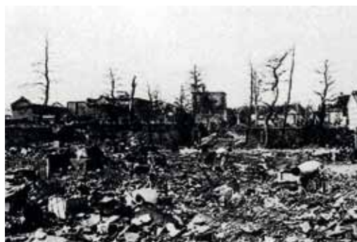
Po skončení druhé světové války zbyly z původní továrny Suzuki Loom Works ruiny