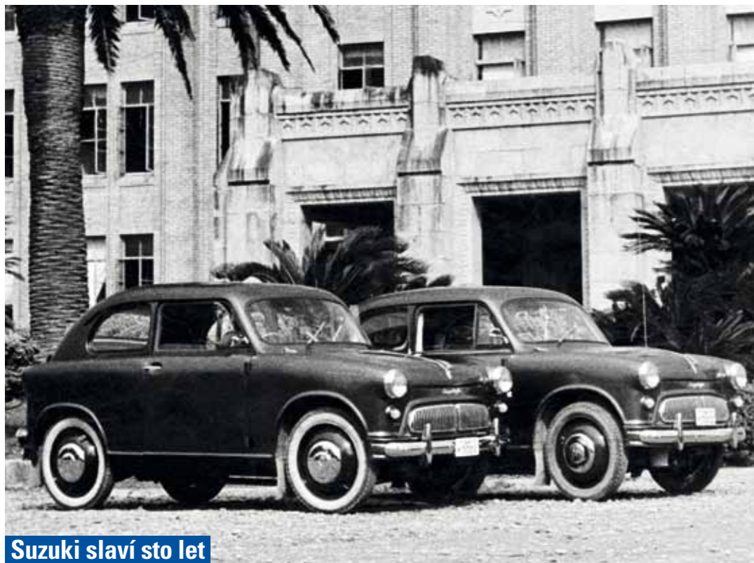
Suzuki slaví sto let